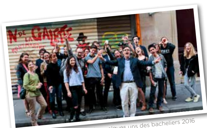
> Les professeurs, entourés de quelques uns des bacheliers 2016