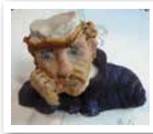
> Terre cuite et émaillée. Olympe Racana