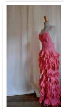
> Confection d'une robe-gant dénonçant la condition féminine. Constance de Dreuille