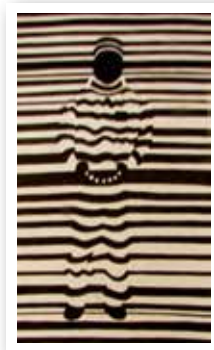
> Encre. Yoann Bry