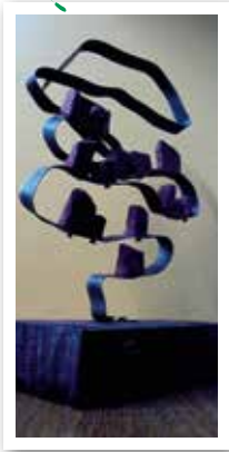
> Sculpture assemblage en métal soudé. Olympe Racana